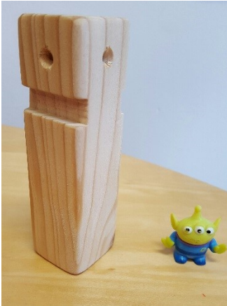
Figuren die vaak gekozen worden bij onbewuste triangulering