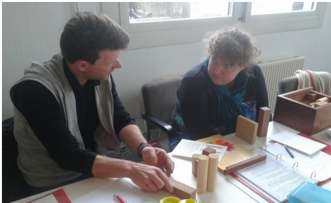
Deelnemers Leergroep Tafelopstellingen

Sinds 2013 heb ik Leergroepen Tafelopstellingen opgezet en begeleid. We starten met een onderzoek van de persoonlijke leerdoelen en het is bijzonder om te volgen hoe de deelnemer het gaan zien . Dat elke keus voor een figuur of voorwerp de 'juiste' keus is, lijnen op tafel onbewust grenzen aangeven, figuren in hun grootte en de schaduw die zij werpen het beeld verhelleren, een losliggend snoer op tafel een functie krijgt of hoe via theezakjes het lot of een opdracht in een systeem wordt geadresseerd. En hoe ook het lichaam van de begeleider resoneert op de informatie van de cliënt en daarmee de begeleidingsantenne vormt.